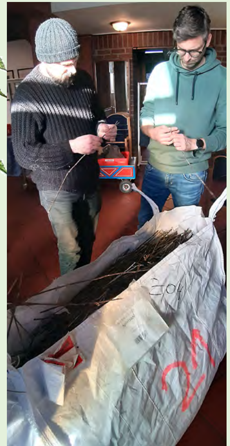
Bild oben: Die Ausbeute der ersten Ernte: ein großer Sack mit den gerösteten Brennesselhalmen