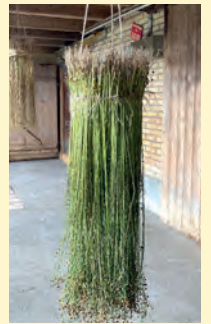
Ganz schön groß - der erste Test-Flachs auf dem Weltacker